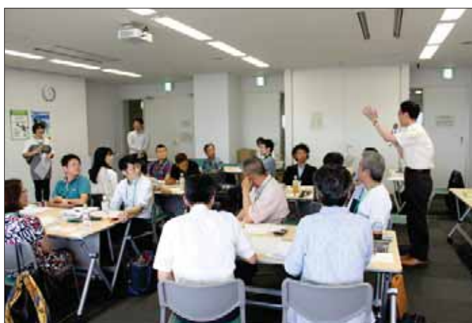
ビジネスプラン発表の様子