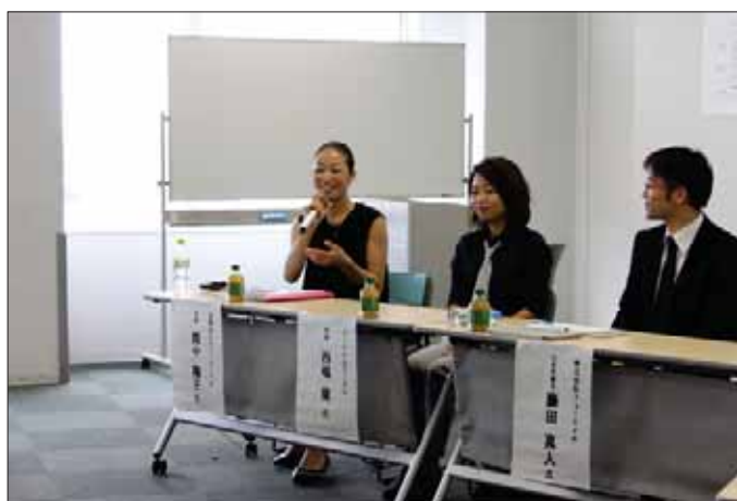
経営者によるパネルディスカッションの様子