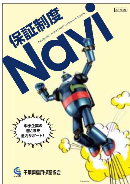
パンフレット表紙

パンフレットに関するお問い合わせは、業務企画課（TEL：043-221-8185）までご連絡ください。