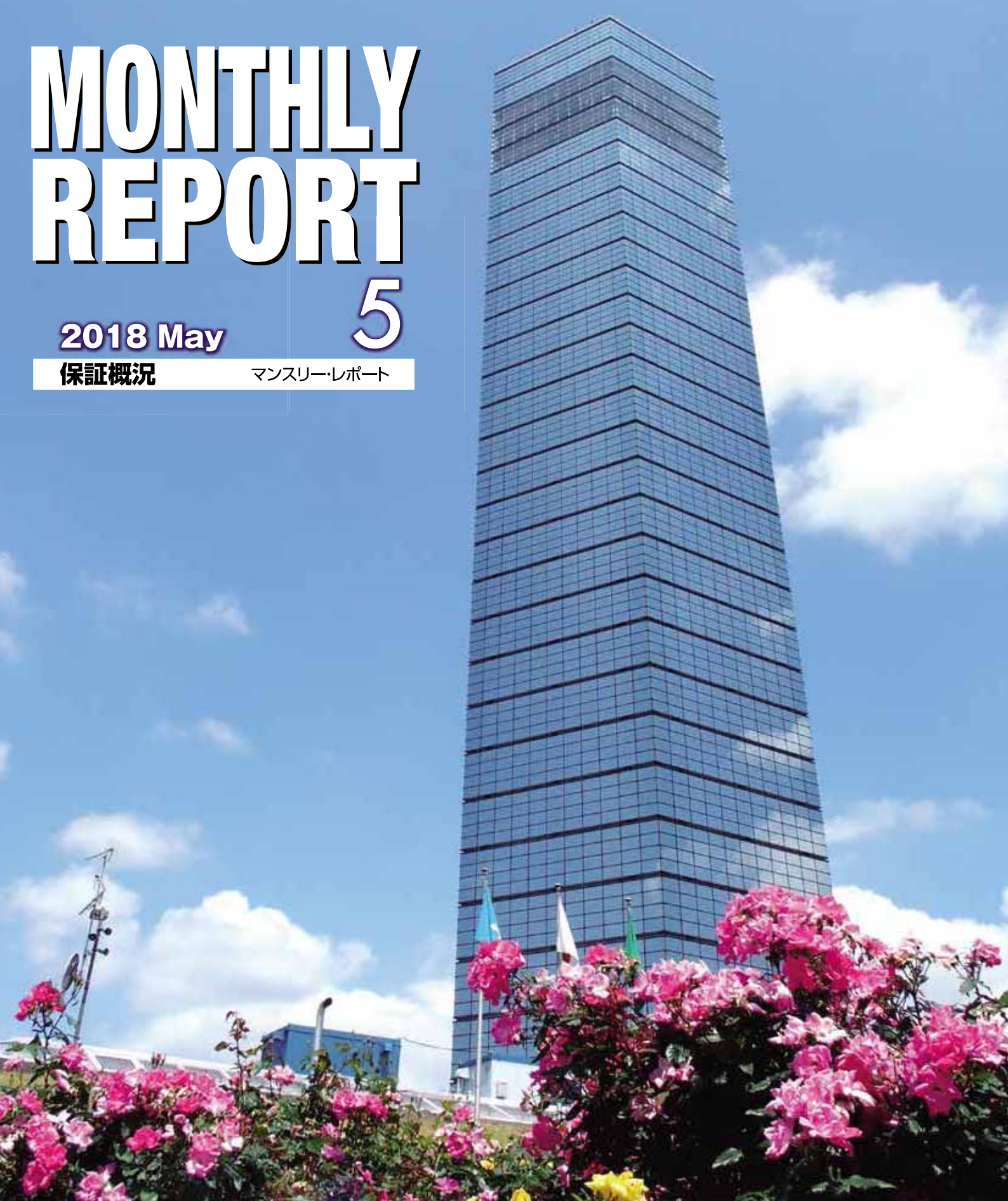
千葉ポートタワー(千葉市中央区)