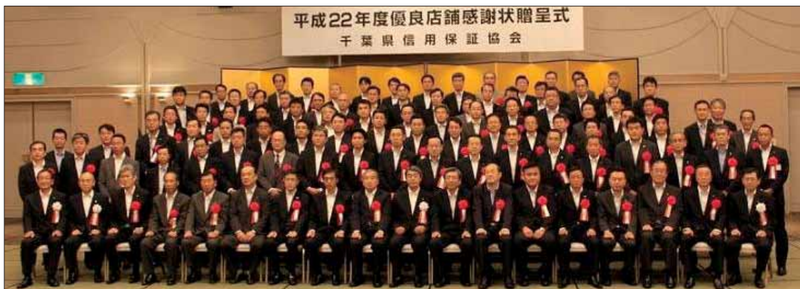
ご来賓および表彰店舗の皆様