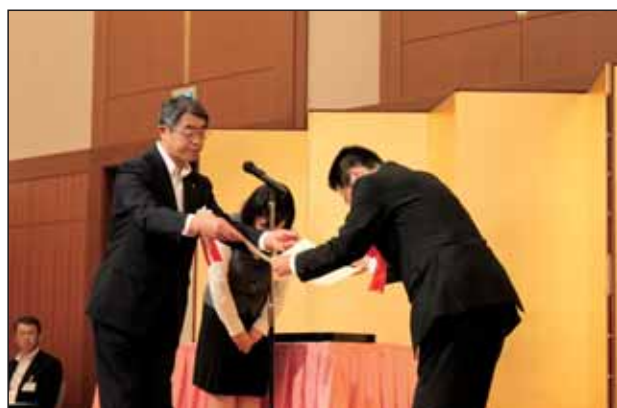
7年連続表彰店舗 千葉興業銀行五井支店白井支店長様と当協会会長