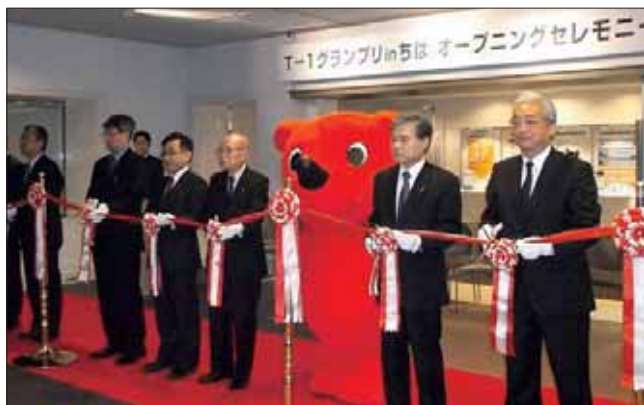
オープニングセレモニーの様子