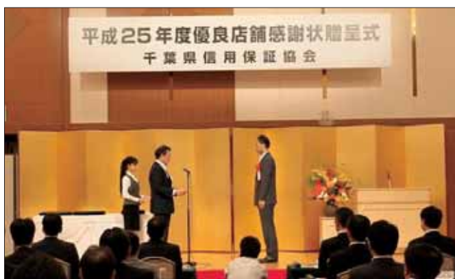
9年連続表彰店舗 千葉興業銀行五井支店湯原支店長様 と当協会会長

店舗の債務残高に応じた保証債務平均残高伸長率、保証承諾伸長率、保証債務平均残高代弁率が一定基準を満たす店舗、創業保証に積極的に取り組まれた店舗（今回追加）。