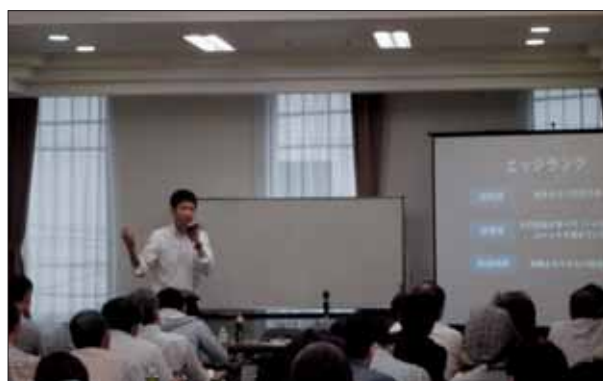
「HP・SNS徹底活用法」の様子