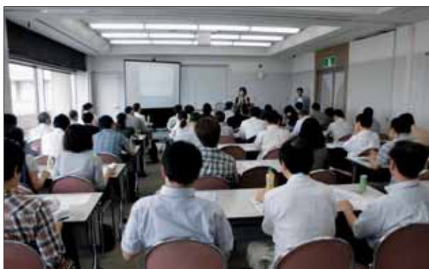
「基本の創業セミナー」の様子

なお、来月号では、平成26年7月5日（土）と平成26年7月12日（土）の創業セミナーについてご報告する予定です。また、平成26年10月に全5回のカリキュラムから成る創業スクールを開催予定であり、詳細についても改めてお知らせします。