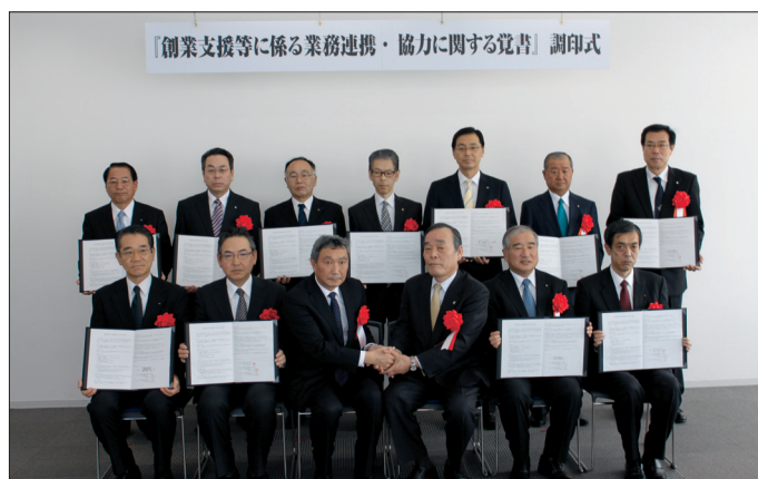
平成27年1月28日 「創業支援等に係る業務連携・協力に関する覚書」 調印式

具体的な業務連携の内容としては、①創業者の資金調達の円滑化（協調融資の実施）に向けた金融機関・日本公庫間での創業者の相互紹介、②各種創業セミナーへの講師派遣、③参加金融機関間の情報交流の促進を目的とした情報交換会議の開催、創業担当者名簿の作成、などを予定しています。