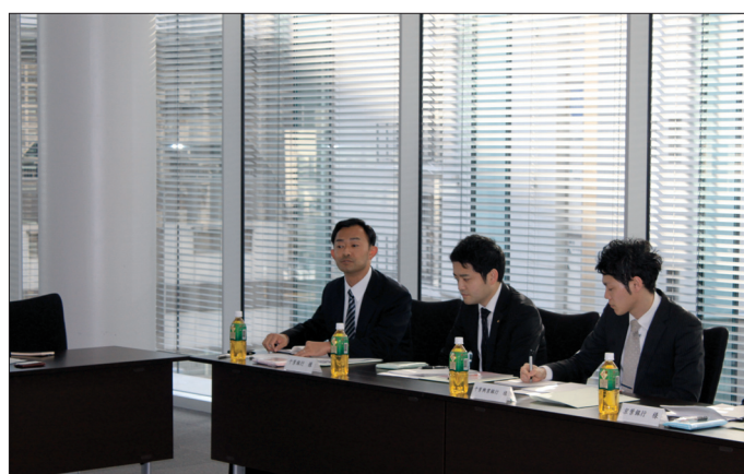
調印式後に行われた参加金融機関担当者による情報交換会議では、各金融機関の創業支援の取組み内容等をご説明頂きました