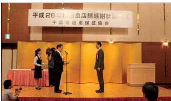
10年連続表彰店舗 千葉興業銀行五井支店湯原支店長様と当協会会長

店舗の債務残高に応じた保証債務平均残高伸長率、保証承諾伸長率、保証債務平均残高代弁率が一定基準を満たす店舗、新制度「新規協会利用者サポート割引キックオフ」・「創業計画実施サポート割引」を積極的に取り組まれた店舗。