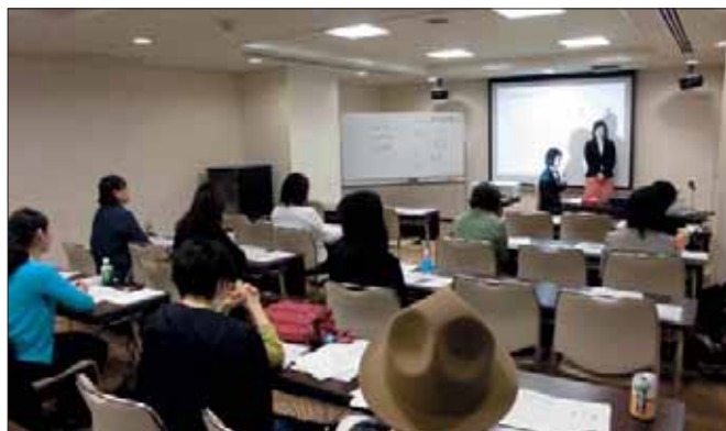
「女性限定セミナー」の様子