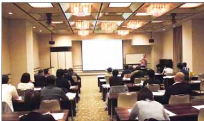
「飲食店開業セミナー」の様子

11名の方々にご参加いただき、参加者から「ロールプレイングが、とてもおもしろかった」「無料で、こういうセミナーに参加できることが良かった」等の感想をいただきました。