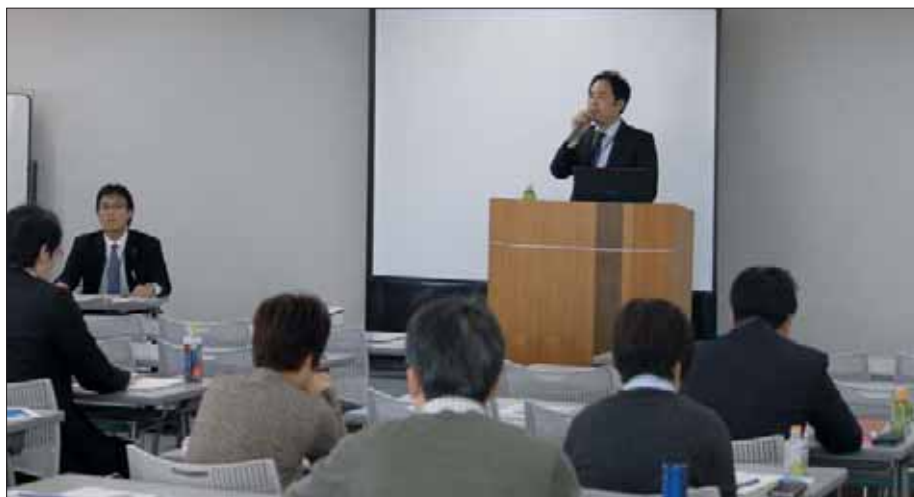
12月1日 研修会の様子

今後とも、当協会では県内経済の活性化に貢献するべく、各支援機関との連携強化に取り組んでまいります。