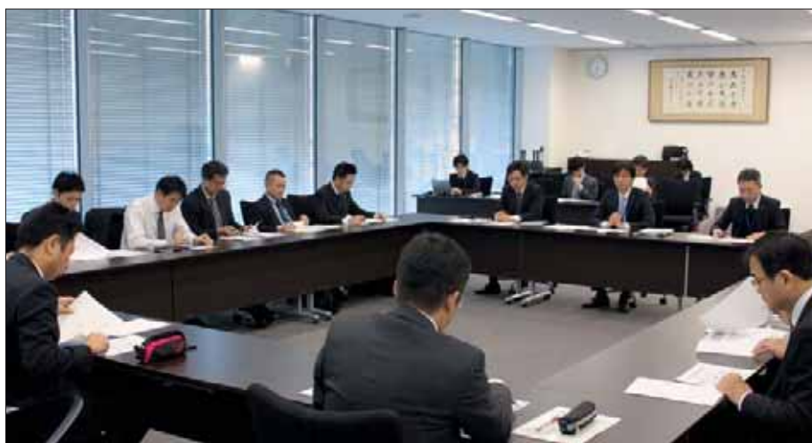
11月27日 創業支援担当者会議の様子

今後も、「創業支援等に係る業務連携・協力に関する覚書」を締結している日本政策金融公庫国民生活事業、県内11金融機関（千葉銀行、千葉興業銀行、京葉銀行、千葉信用金庫、銚子信用金庫、東京ベイ信用金庫、館山信用金庫、佐原信用金庫、房総信用組合、銚子商工信用組合及び君津信用組合）及び県外1金融機関（東京東信用金庫）のオール千葉体制で、創業支援に取り組んでまいります。