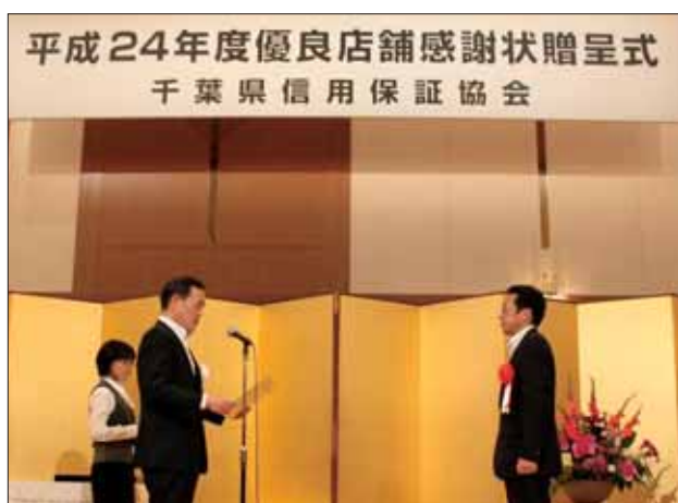
8年連続表彰店舗 千葉興業銀行五井支店白井支店長様 と当協会会長

店舗の債務残高に応じた保証債務平均残高伸長率、保証承諾伸長率、保証債務平均残高代弁率が一定基準を満たす店舗。