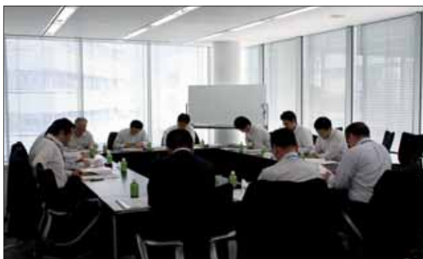
平成25年5月21日（火）の意見交換会の様子

※千葉県中小企業支援ネットワーク会議とは、当協会が事務局を努め、千葉県、千葉県再生支援協議会、県内金融機関、経営支援団体等が参加し、県内中小企業の経営改善・事業再生支援の環境整備を図るために設置された会議です。