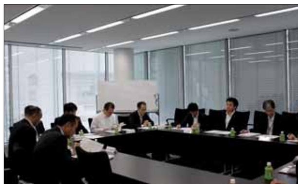
平成25年5月28日（火）の意見交換会の様子