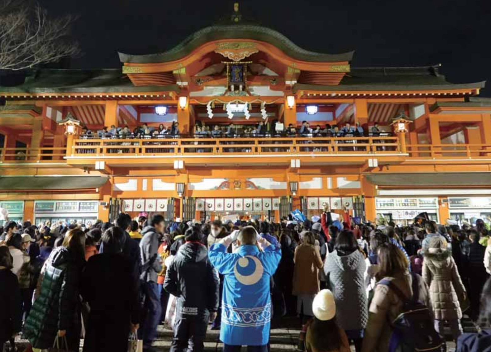
千葉神社の節分(千葉市中央区)