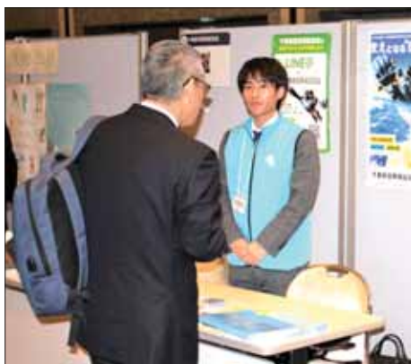
当協会相談ブース