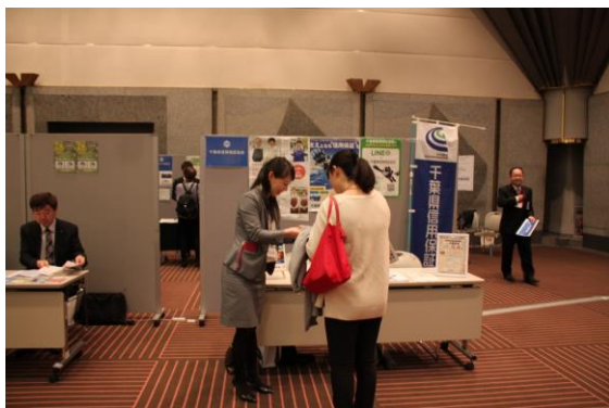
【創業ブースの様子】