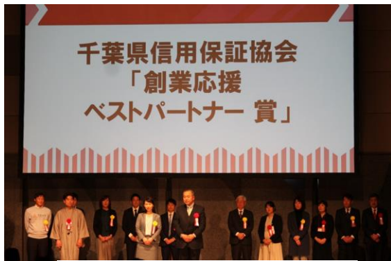
【協賛企業賞の授与の様子】

今後も、県内の起業機運の醸成に貢献し、お客さまへの経営支援に一層力を入れてまいります。