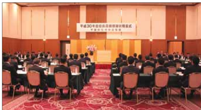
【昨年度の優良店舗感謝状贈呈式の様子】