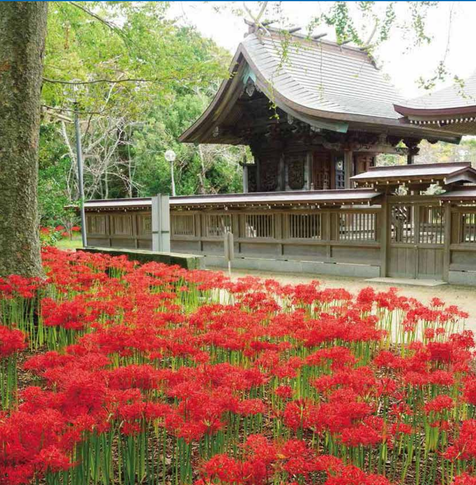
白子神社の彼岸花(白子町)