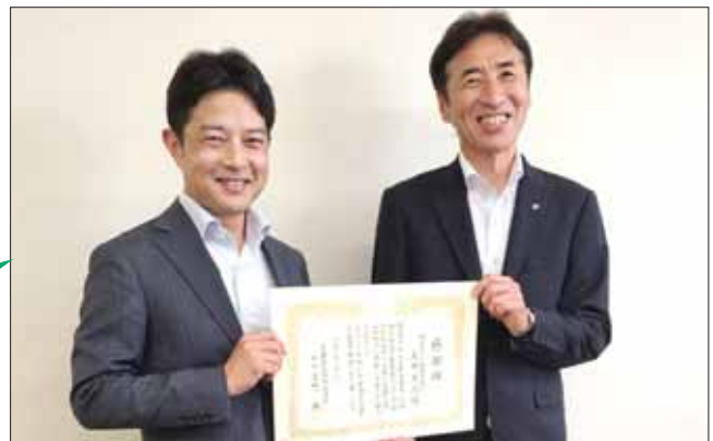
（左：西村支店長、右：保証部秋葉部長）