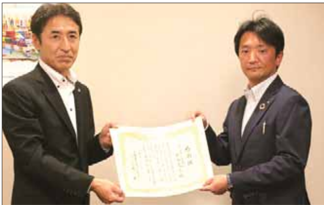
（左：保証部秋葉部長、右：杉原執行役員中央支店長京成駅前支店長）