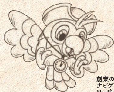
創業の書 ナビゲーター サポ