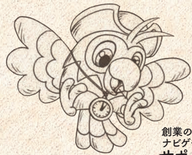
創業の書 ナビゲーター サポ