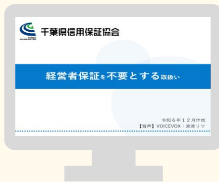
経営保証を不要とする取り扱い解説動画