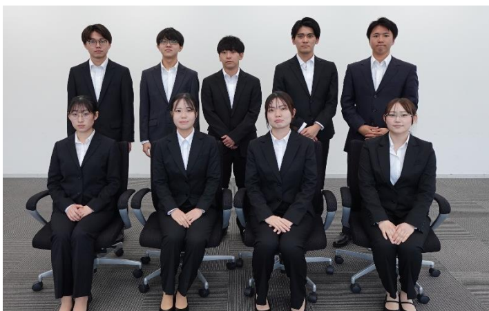
新入職員からひとつ

今年の4月より当協会に入協しました9名です。 保証部保証第一課・保証部保証第二課・松戸支店保証課に配属となります。 皆様、どうぞよろしくお願いいたします。