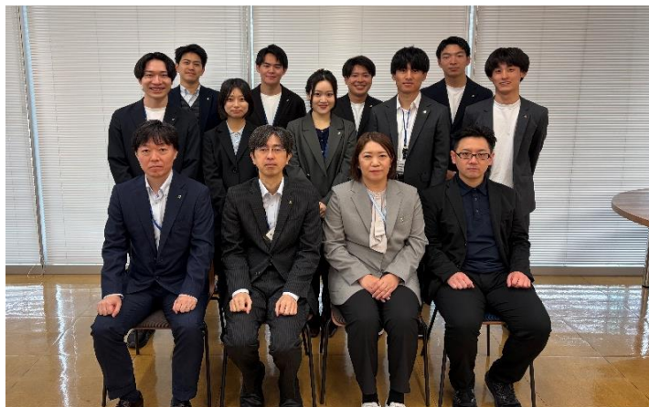
協課長（前列中央左）からひとこと

保証部保証第二課は人事異動に伴うメンバーの交代があり、3名の新入職員を含めた新体制となりました。金融機関・各関係機関の皆様と連携し、引き続き県内中小企業者のベストパートナーとして、きめ細やかな対応を心がけてまいります。よろしくお願いいたします。