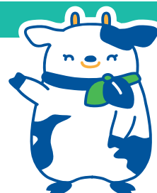
イメージキャラクター 「モ〜スケ」